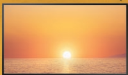
The Terrace : la TV d'Extérieur