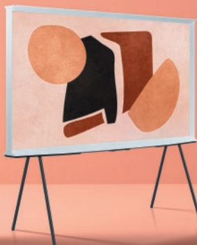
The Serif : la TV Design